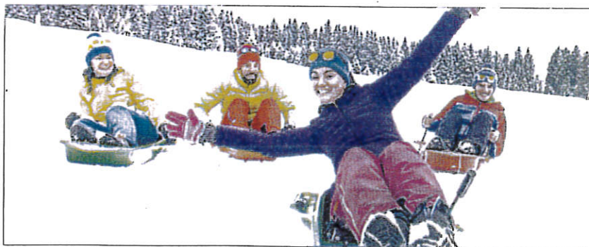
Cette nouvelle piste de luge connectée est une première dans le secteur.

La pente n'excédant pas 15%, les enfants de plus de 10 ans pourront l'utiliser librement. Quant aux plus petits, ils glisseront avec leurs parents sur des luges à deux places. Une aire de pique-nique (avec tables, bancs et barbecues) sera à la disposition de tous, à mi-parcours, au niveau de la Cabane du Loup, au Plat des Échapeaux.